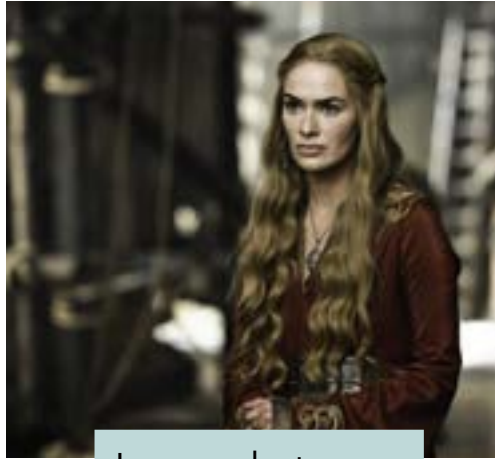
Juego de tronos