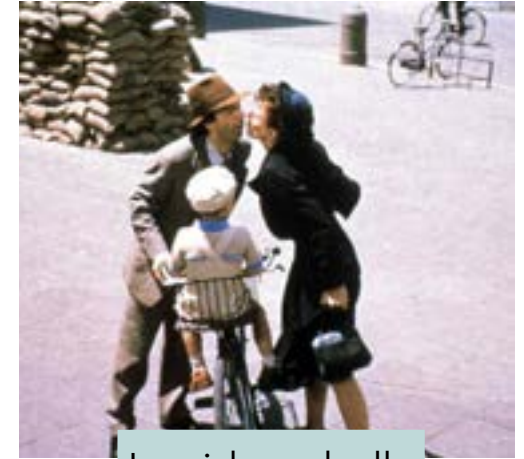
La vida es bella