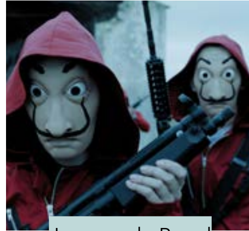
La casa de Papel