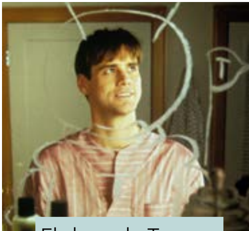
El show de Truman